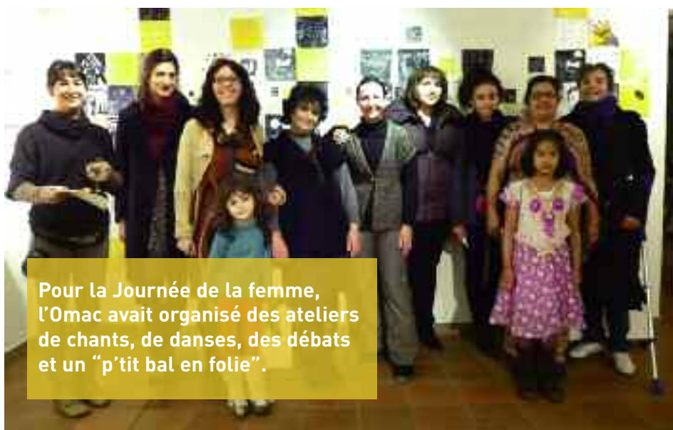
Pour la Journée de la femme, l'Omac avait organisé des ateliers de chants, de danses, des débats et un "p'tit bal en folie".